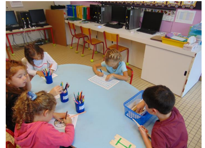
Trouver le chemin du 2, du 3, du 4, du 5.